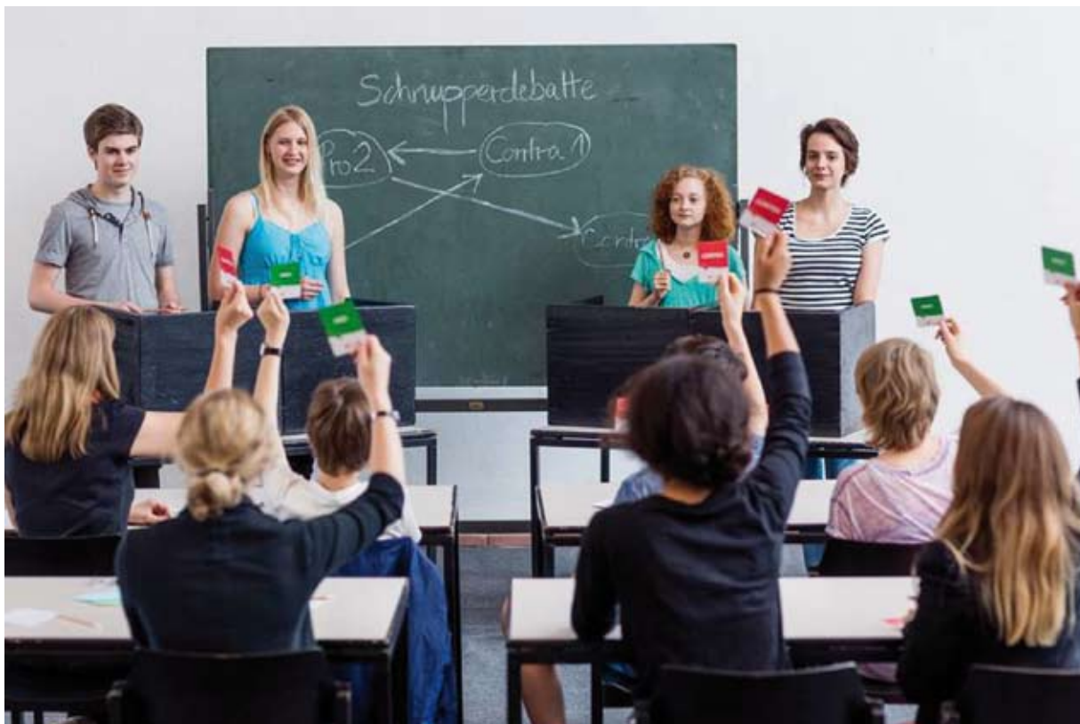
Ein Training zum Wettbewerb „Jugend debattiert“ als Beispiel für eine Debatte im Unterricht. [Jugend debattiert]

rung gehört die Reduzierung der Komplexität von Realität bzw. die Auswahl von Beispielen. Dazu werden die vielfältigen Zusammenhänge der Wirklichkeit auf ihren Grundgehalt zurückgeführt. Das fordert zum einen die Sachkenntnis des Lehrenden, um die Wirklichkeit nicht zu verfälschen. Zum anderen wird eine bewusste Vermittlung dieser didaktischen Reduktion bzw. Konstruktion benötigt, um die SchülerInnen nicht zu täuschen.