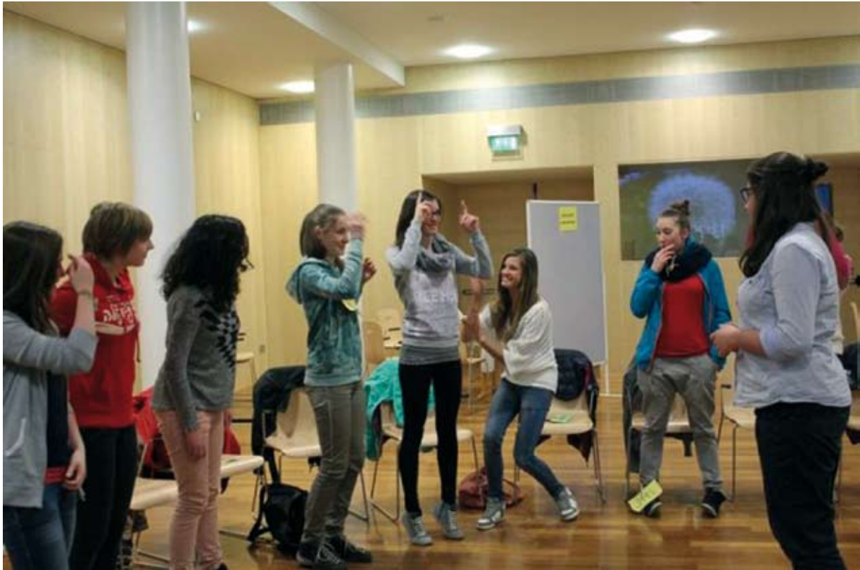
Das Lernspiel „Civil Powker“ als Beispiel für ein Simulationsspiel im Unterricht.