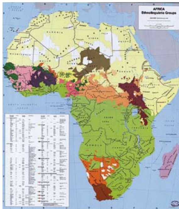
Divergente ethnische und politische geographische Struktur sind mögliche Ursachen von Konflikten - z.B. in Afrika.

allein die Überlegenheit der zivilen bzw. gewaltlosen über die militärische bzw. gewaltvolle Konfliktbearbeitung) und empirische Analysen, die sie einbezieht. Darum können die Themen der Friedensbildung normativ oder empirisch formuliert werden. Beide Ebenen überlagern einander, d.h. beide sind immer vorhanden, doch eine steht jeweils im Vordergrund, eine im Hintergrund - je nach Blickwinkel.