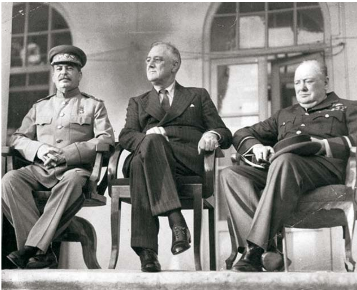
Josef Stalin, Franklin Roosevelt und Winston Churchill (hier auf der Konferenz in Teheran 1943) wurden aus politischen Gründen von Verbündeten im zweiten Weltkrieg zu Gegnern im Kalten Krieg.

Konfliktbearbeitung gesehen wird, dann liegt wohl ein gewisser Schwerpunkt der Inhalte auf der Politik. Wenn Friedensbildung im weiteren Sinne, d.h. als Auseinandersetzung mit gewaltvoller Konfliktbearbeitung gesehen wird, dann streuen wohl die Inhalte mehr in die Soziologie, Psychologie, Philosophie/Religion. Letzteres entspricht wohl dem, was oben Friedenspädagogik genannt wurde. 24 Es ist also sinnvoll, Friedensbildung v.a. als friedenspolitische Bildung zu sehen, doch nicht als genau abgegrenzte Inhalte gegenüber anderen politischen Bildungsansätzen, sondern als inhaltlicher Schwerpunkt mit sich überschneidenden Randbereichen.