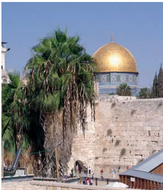
Die Klagemauer und der Felsendom in Jerusalem - ein Symbol für religiöse Differenzen als mögliche Ursachen von Konflikten.