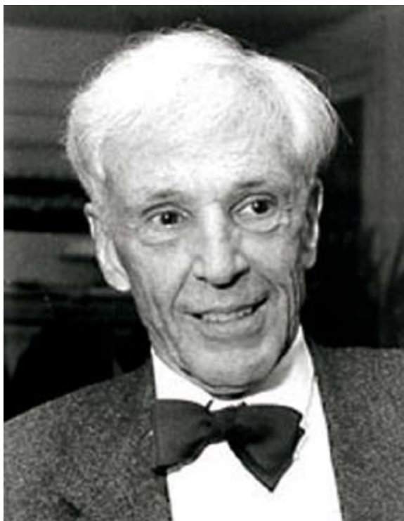
Hartmut von Hentig.